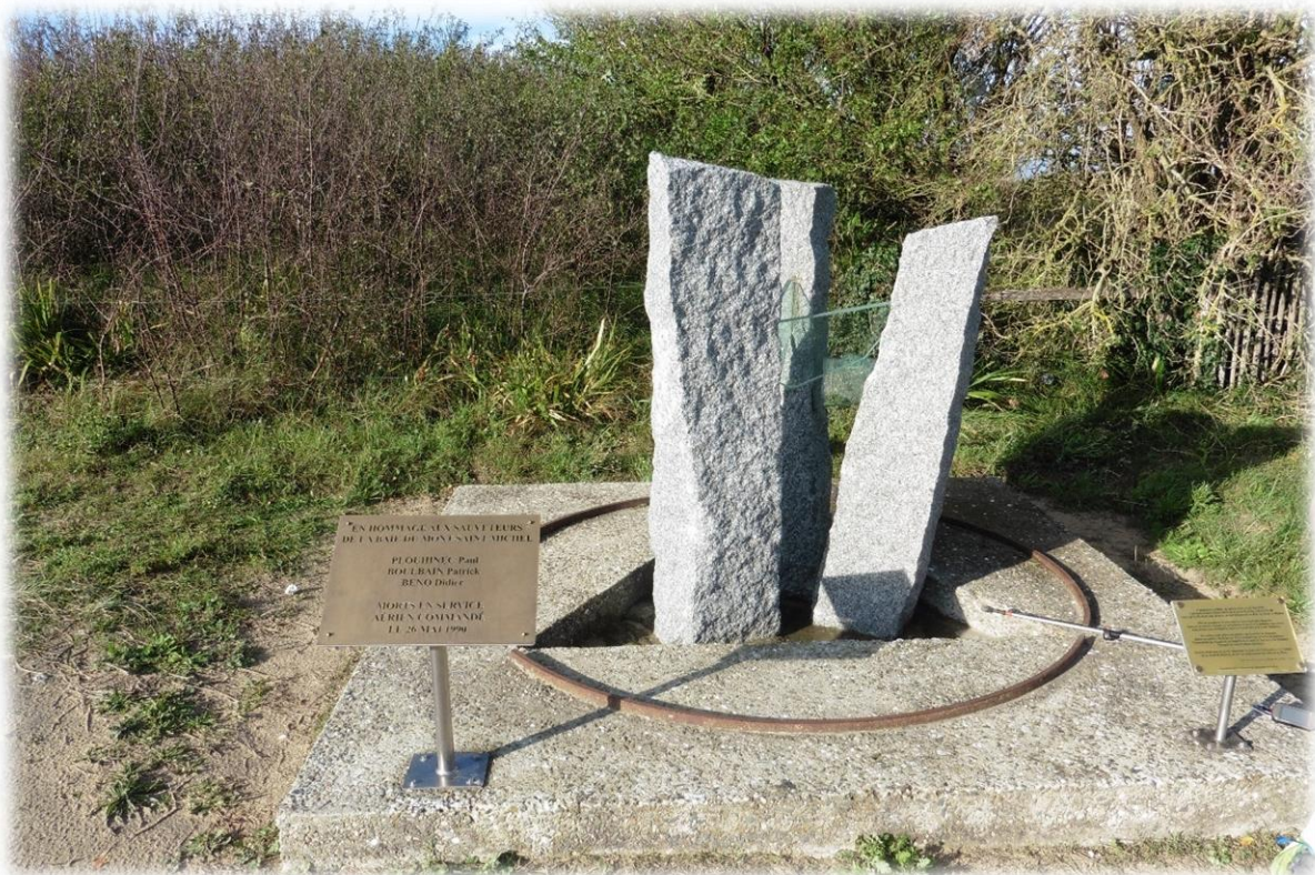
Op deze plaats stortte op 26 mei 1990 een burgerlijke heliocopter, een Dragon 50, neer die materiaal had geleverd aan de Mont-Saint-Michel. Bij deze crash kwamen alle drie