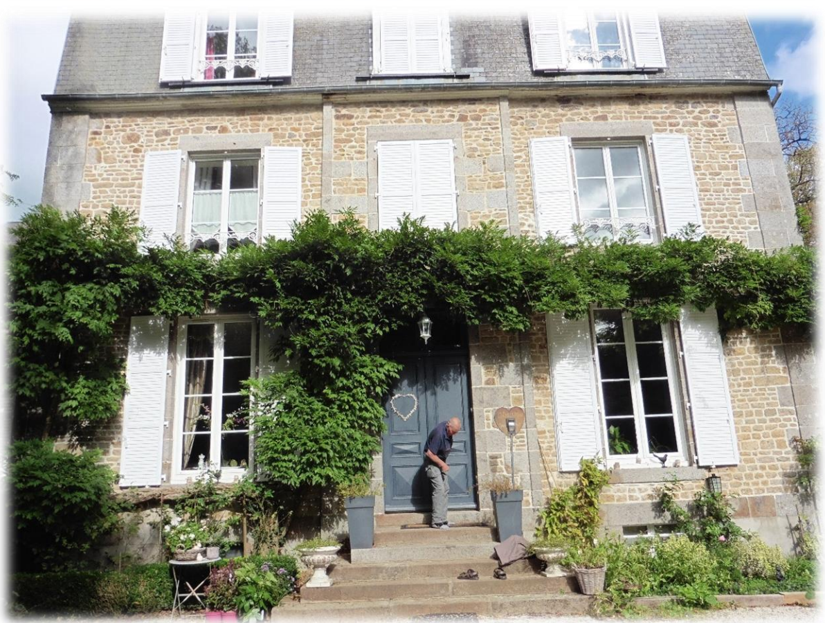
Kasteelheer Henk trekt de deur van zijn stulpje achter zich dicht.