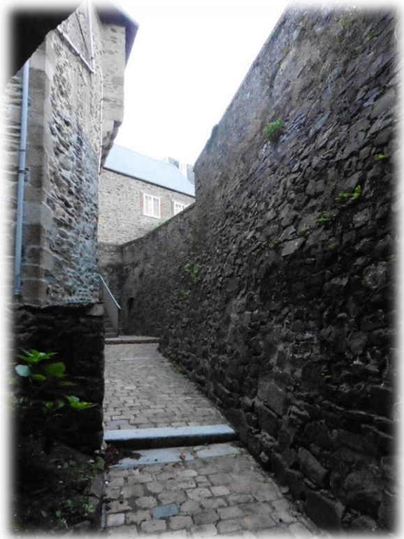
De historische stad Granville ligt in La Haute-Ville met de oude vestingswallen en de Église Notre-Dame (15de eeuw), met het uitzichtpunt Pointe du Roc. Onder het bestuur van